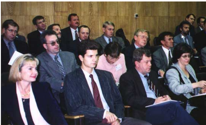
Открытие семинара в Министерстве Экономики РФ

Выступившие на секциях и пленарных заседаниях подтвердили безусловную полезность изучения канадского опы-