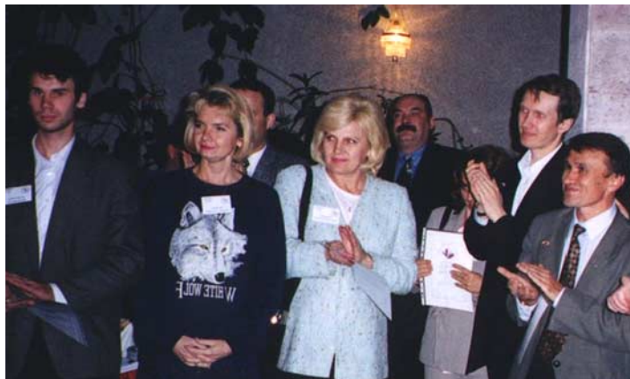
Вручение сертификатов новым члена Клуба

Совет Российско-Канадского клуба президентских стипендиатов.