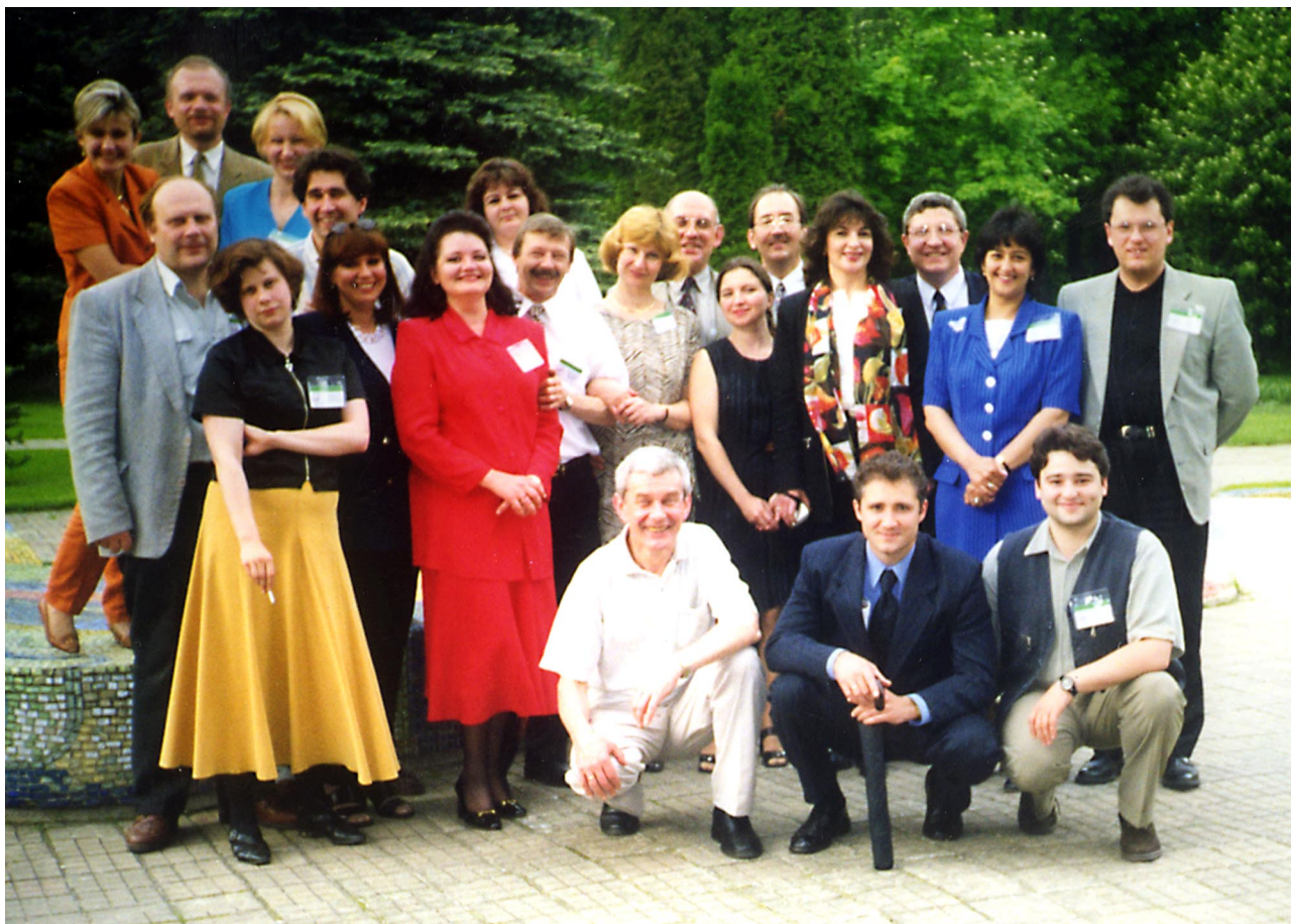
Первая отчетно-выборная конференция Клуба (Голицино, 1998)